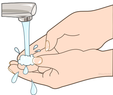
Handen wassen мити руки