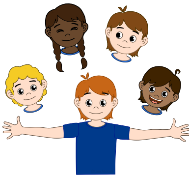
Gezamenlijk щось разом робити