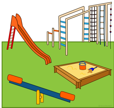
speeltuín дитячий майданчик